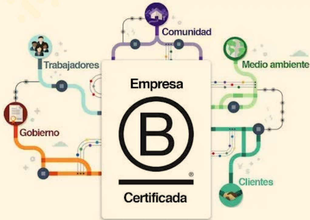
Imágenes página Sistema B

De esta manera, FIBTEX ha modificado sus estatutos y ha adoptado políticas que le permiten mantenerse como una empresa sostenible a largo plazo. Los ideales de las Empresas B reflejan los valores fundamentales de FIBTEX, ya que, desde su fundación, la empresa se ha inspirado en "No solo ser la mejor empresa del mundo, sino la mejor empresa para el mundo".